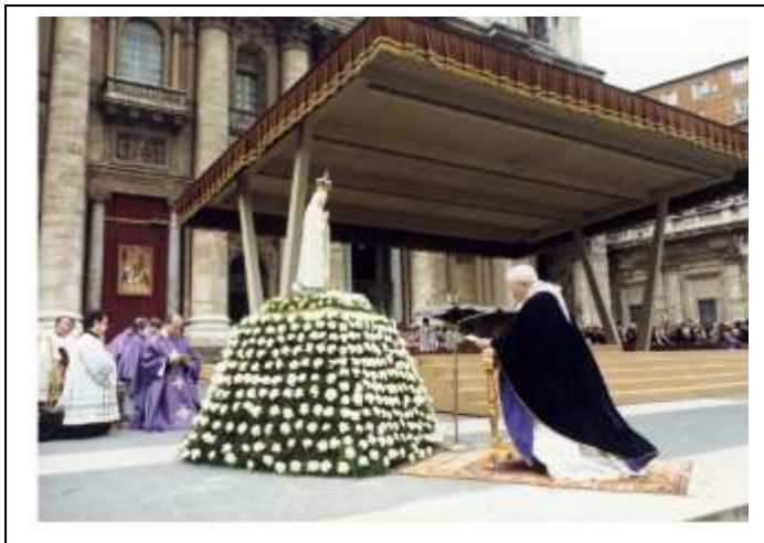
Đức Giáo Hoàng Gioan Phaolo II dâng hiến thể giới cho Đức Mẹ Fatima ngày 25 tháng 3 - 1984 tại Vatican