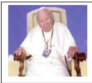
Thánh GH Gioan Phaolo II Đã mặc Áo Đức Bà từ nhỏ cho đến khi Ngài qua đời

Vì thế muốn được Chúa và Đức Mẹ Maria bảo vệ thì cần phải phục vụ Chúa và Đức Mẹ Maria. Áo Đức Bà Màu Nâu có thể nâng cao cuộc sống thiêng liêng và giúp đỡ chúng ta trong thời đại mà chúng ta cần được Thiên Đàng trợ giúp.