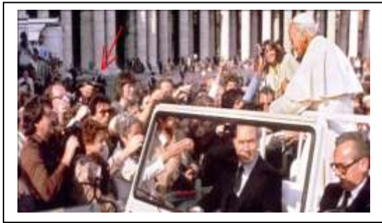
Mũi tên đỏ chỉ nơi cây súng nhắm bắn Đức Giáo Hoàng Gioan Phaolô II

Qua những gian nan và những thử thách của Giáo Hội, loài người đang đón nhận sự mới khởi thắng của Trái Tim Mẹ. Và cũng là để cho nhân loại nhận thấy rằng những việc xảy ra cho thế giới đúng như lời Đức Mẹ đã tiên báo. “Đức Giáo Hoàng phải chịu nhiều đau khổ!”