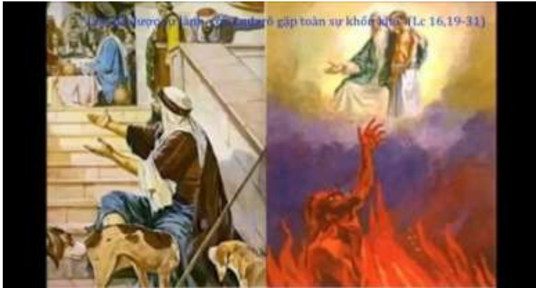
Người giàu kẻ nghèo

Trong truyền thống của Giáo Hội, có lời Kinh Tuần Bảy Ngày Cầu nguyện cho các Linh Hồn trong luyện ngục, trong ngày thứ 2 có đoạn viết: