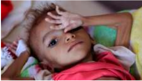
Thiếu dinh dưỡng

đó, có tới 20.000 trẻ em dưới 5 tuổi chết vì đói mỗi ngày.